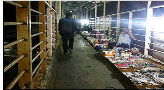
Gambar 16.. Jembatan Penyebrangan Cawang UKI, Dimanfaatkan oleh PKL