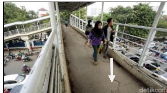
Gambar 17.. Jembatan Penyebrangan Cawang UKI, Retak.

Letak jembatan secara umum dapat dilihat bahwa letak patung sebagai elemen pada lanskap jalan selain bersifat mengisi traffic island yang ada juga meningkat kan estetika lanskap jalan Let Jen Sutoyo dan menjadi mercu tanda kawasan tersebut.