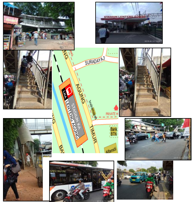
Gambar 11. Kondisi fisik JPO dan lingkungannya

Hasil pengamatan JPO di stasiun Lenteng Agung dan sekitarnya tersaji pada Gambar. 11.