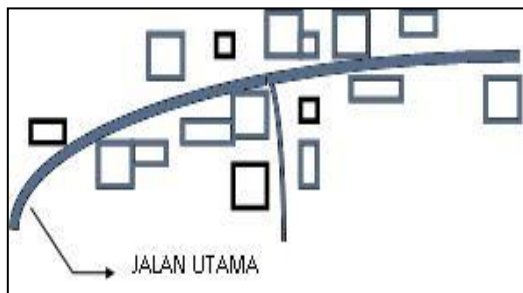
Gambar 4.: Jaringan Pola Jalan Ring (Radial). (Sumber :Markus Zahn, 1999).

Kawasan perkotaan mempunyai konsentrasi populasi dan intensitas tata guna lahan/ tanah yang tinggi. Tata guna tanah digunakan untuk perkantoran, pertokoan, industri, perumahan dan sekolah dan lain-lain. Kebutuhan akan akses tinggi sehubungan konsentrasi penduduk yang tinggi. Catenese, A.J dan Snyder, J.C. (1979) . Mengatakan bahwa ada tiga tipe dasar bentuk jalan utama yang dikembangkan dalam kawasan di daerah perkotaan sebagai berikut: