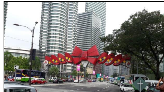
Gambar 5.. Keindahan Bentuk Jembatan Orang di Kuala Lumpur, Malaysia . (Sumber: Pribadi 2017).

Jembatan adalah suatu struktur konstruksi yang memungkinkan rute transportasi melalui sungai, danai, kali, jalan raya, jalan kereta api, orang dan lain-lain. Jembatan penyebrangan orang atau JPO dapat dijadikan sebagai elemen kota dengan fungsi pengindahan atau ( Beautification ). Pengindahan atau beautification merupakan upaya untuk meningkatkan aspek keindahan kota. Gambar 5 dan 6.