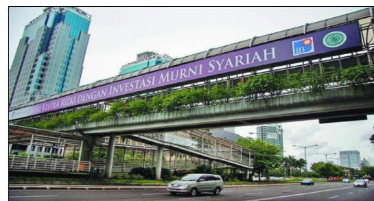
Gambar 13. JPO di Pasar Tanah Abang. Jakarta Pusat. (Sumber:12 Agustus 2019 Detik Com).

Dari hasil analisa didapatkan bahwa penyeberangan jalan yang menggunakan JPO sebesar 95,07 % sedangkan yang tidak menggunakan Jembatan Penyeberangan Orang sebesar 4,93%. Adapun penyeberangan jalan yang menggunakan Jembatan Penyeberangan Orang dengan alasan keselamatan sebesar 50,35%, hal ini menunjukkan bahwa penyeberangan jalan