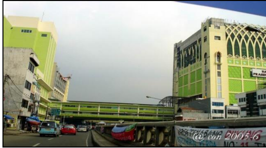
Gambar 7 . Jembatan penyeberangan Pondok Indah PIM II Jakarta Selatan.

dan lebar atau menyeberang jalan tol dengan menggunakan jembatan sehingga orang dan lalu lintas kendaraan dipisahkan secara fisik. Seperti Contoh pada Gambar 7.