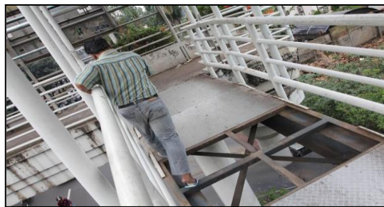
Gambar 9. Kondisi jembatan penyeberangan orang. (Sumber: 12 Agustus 2019 Detik Com)

Saat ini JPO tersebut banyak yang tidak memenuhi persyaratan berlubang dan perilaku pengguna jembatan penyeberangan orang, Gambar 7 dan 8.