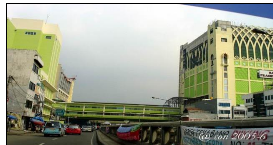
Gambar 12. JPO yang menghubungkan Pondok Indah Mall I dengan Pondok Indah Mall II. Jakarta Selatan.

dipergunakan untuk menuju tempat satu ke tempat lainnya, dapat juga dari Peralihan moda satu ke moda lainnya (seperti busway Transjakarta di Indonesia). Jembatan ini juga menghubungkan ke bus way dengan koridor konekting ke stasiun kereta api, (Koridor Bus Way Cikoko Cawang dengan Stasiun kereta api Cawang, stasiun Sudirman dll). Jembatan JPO ini dapat pula di pergunakan dari Jembatan penyebrangan orang saat ini belum memberikan akses kepada pengguna kursi roda. Hanya Jembatan Penyebrangan Orang seperti ditempat pemberhentian bus di Jl. M.H Thamrin, Jakarta yang sudah memberikan ruang bagi para pemakai kursi roda menggunakan tangga berjalan ataupun dengan menggunakan lift. JPO antara PIM I dan PIM II di Jl. Arteri Pondok Indah, Jakarta. Salah satu pendekatan lainnya yang digunakan seperti dikawasan perbelanjaan yang ramai dengan mengkombinasikan JPO pertokoan/perbelanjaan seperti contoh Gambar 12, 13 dan 14 .