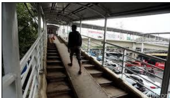
Gambar 15. Jembatan Penyebrangan Cawang UKI, mempergunakan Ram.

Kondisi Fisik JPO ini memiliki ram . untuk kursi roda, tetapi menurut pengamatan kami masih terlalu terjal sehingga masih sulit untuk dilalui kursi roda. Cawang. Gambar 13. Pada JPO ini juga di pergunakan oleh Pedagang Kaki Lima (PKL), yang memnfaatkan jembatan sebagai tempat berjualan dan sangat strategis dengan banyaknya orang yang lalu langang pada jembatan tersebut. Gambar 15 dan 16.