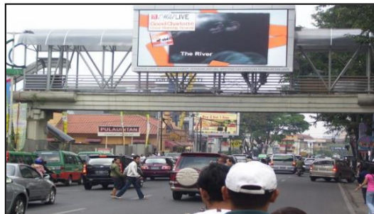
Gambar 8. Jembatan penyeberangan Pondok Indah PIM II Jakarta Selatan. (Sumber: 12 Agustus 2019 Detik Com).