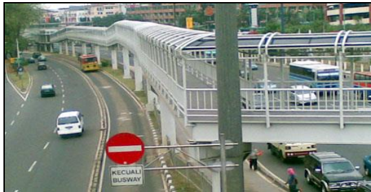
Gambar 14. JPO di Pusat Perbelanjaan Mangga Dua Jakarta Utara.

mayoritas menganggap alasan keselamatan merupakan hal yang terpenting dalam menyeberang jalan