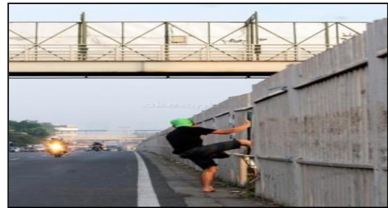
Gambar 10. Prilaku pengguna jembatan penyeberangan.

Saat ini JPO tersebut banyak yang tidak memenuhi persyaratan berlubang dan perilaku pengguna jembatan penyeberangan orang, Gambar 7 dan 8.