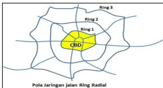
Gambar 3. Jaringan Pola Jalan Ring (Radial)