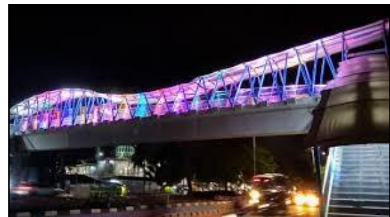
Gambar 6. Keindahan Jembatan Penyebrangan Orang Jalan Dr Sumarno, Jakarta Timur ( Sumber Foto: @Bina Marga DKI).