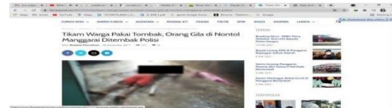
Gambar 17 Berita Flores Pos 1

Pasal 8 (Wartawan Indonesia tidak melempar menu atau berita berdasarkan penilaian atau tingkat diskriminasi)