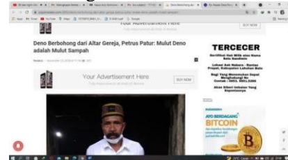
Gambar 15. Berita Pojok Redaksi 1

PASAL 1 (Wartawan Indonesia bersikap independen, menghasilkan berita yang akurat, berimbang, dan tidak beritikad buruk).