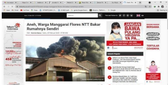
Gambar 15. Berita: Aneh Warga Manggarai Flores NTT,

Pasal 3 (Wartawan Indonesia selalu menguji informasi, memberitakan secara berimbang, tidak mencampurkan fakta dan opini yang menghakimi, serta menerapkan asas praduga tak bersalah)