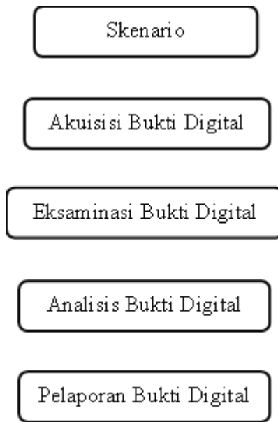
Gambar 1. Topologi Dari ISP

Berdasarkan gambar diatas maka dapat dijelaskan bahwa adalah gambar topologi ISP sampai ke sistem operasi .