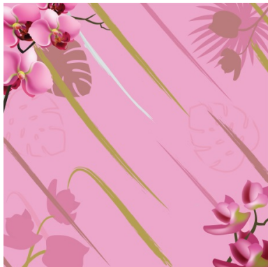
Gambar 1 Motif floral Anggrek