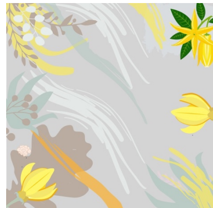
Gambar 5 Motif floral Kenanga

Bentuk Bunga Kenanga yang digambarkan disini berupa bentuk stilasi dari bentuk aslinya. Warna kuning pada bunga menampilkan kesan cerah dan menjadi sangat menonjol dengan dasar warna yang netral.