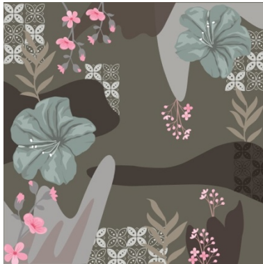
Gambar 6 Motif floral Ashar