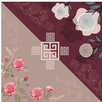
Gambar 11 Motif floral Mawar

Bentuk Mawar yang ditampilkan merupakan bentuk realis, sesuai dengan aslinya. Namun bentuk Mawar ini kemudian mengalami transformasi bentuk yang tidak sesuai lagi dengan bentuk aslinya. Penggunaan warna merah marun dan coklat muda menampilkan kesan netral dan elegan pada desain scarf ini.