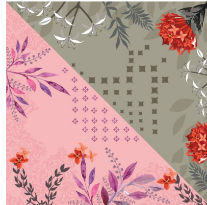
Gambar 9 Motif floral Asoka