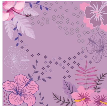
Gambar 7 Motif floral Kembang Sepatu