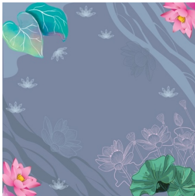
Gambar 4 Motif floral Teratai

Penggunaan warna yang didominasi warna abu-abu memberikan kesan natural dan feminin.