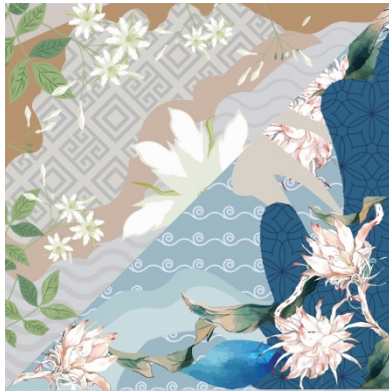
Gambar 8 Motif floral Wijaya Kusuma