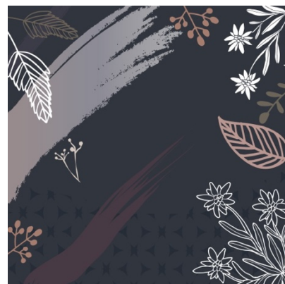
Gambar 3 Motof floral Edelweiss

Warna dasar scarf yang hitam memberikan kesan misterius dan elegan sehingga edelweiss yang digambarkan menjadi lebih terlihat menonjol.