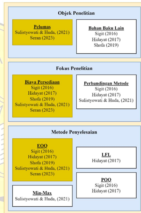
Gambar 2. Pemetaan Keterkaitan Masalah Berdasarkan Penelitian Terdahulu

digunakan untuk mengkategorikan persediaan menggunakan nilainya sebagai dasar klasifikasi. Setiap item persediaan akan diberi label yang sesuai dengan kelasnya. Dengan metode periodic review , sumber daya diinventarisasi dan dipesan dalam jangka waktu yang telah ditentukan.