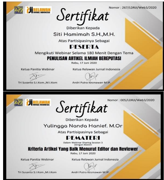
Gambar 5. e-Certificate untuk pemateri dan peserta

Sebagai ucapan terimakasih dan penghargaan kepada pemateri dan peserta maka pelaksana kegiatan ini memberikan e-certificate yang dikirimkan melalui email masing-masing.