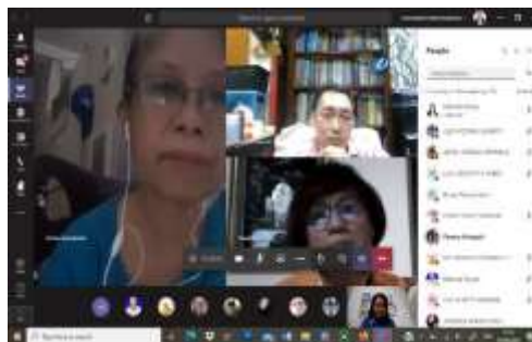
Gambar 1. Rapat Persiapan PKM

Metodologi penulisan laporan ini adalah dengan metode deskriptif. Metode pelaksanaan diawali dengan rapat perencanaan, persiapan bahan, pelaksanaan dan evaluasi melalui microsoft teams yang disediakan oleh UKI.