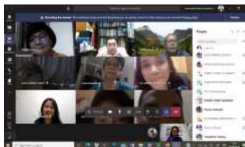
Gambar 2. Melatih Mahasiswa dalam Persentasi

Kegiatan dilakukan dalam rangkaian pelatihan untuk memotivasi peserta webinar terhadap situasi New Normal dalam rangka kegiatan kerjasama antara Fakultas Ekonomi dan Bisnis Universitas Kristen Indonesia Jakarta dengan Lions Club .