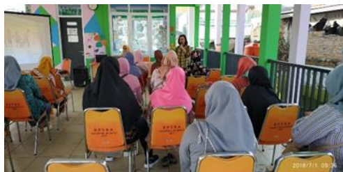
Gambar 3. Simulasi Online Pengajuan IUMK

Penyuluhan berisi materi tentang syarat perizinan. Pergub Nomor 30 tahun