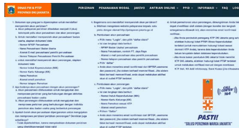
Gambar 5. Panduan Pendaftaran Akun Perizinan v2.0

Kependudukan (Dinas Kependudukan dan Catatan Sipil Pemprov DKI Jakarta).