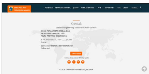
Gambar 4. Web Pelayanan PTSP DKI Jakarta di http://pelayanan.jakarta.go.id/

Tahap dalam simulasi terdiri dari: Tahap 1: Membuat akun. Pemohon mengunjungi web di laman http://pelayanan.jakarta.go.id/ (Gambar 4).