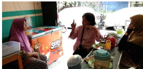
Gambar 1. Wawancara dengan Pelaku UMK

Pada tahap ini, dilakukan observasi kegiatan usaha dan wawancara masyarakat yang memenuhi persyaratan sebagai peserta penyuluhan dan simulasi. Masyarakat yang berminat diseleksi berdasarkan persyaratan 1. Memiliki usaha dan belum memiliki IUMK, 2. Belum memiliki usaha dan memiliki program kegiatan usaha. Sedangkan wawancara dilakukan untuk mencari kebutuhan masyarakat terkait dengan proses penerbitan IUMK. Tujuan wawancara ini adalah dalam rangka membuat materi yang tepat isi dan sasaran (Gambar 1).