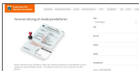
Gambar 6. Tampilan Menu Buat Akun

Tulis di kolom pencarian Izin Usaha Mikro dan Kecil. Akan muncul menu Izin Usaha Mikro dan Kecil. Kemudian klik Izin Usaha Mikro dan Kecil (IUMK) (Gambar 7), kemudian silahkan diklik.