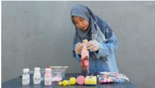
Gambar 15. Pelaksanaan Pendampingan

Kegiatan selanjutnya yang akan dilakukan adalah melakukan monitoring kepada Ibu-Ibu PKK Kelurahan Cipinang Melayu. Kami juga akan melakukan evaluasi pelaksanaan abdimas tersebut apakah hasil yang dicapai sudah sesuai dengan target yang ditetapkan