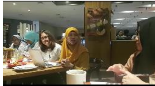
Gambar 11. Pelaksanaan Pendampingan