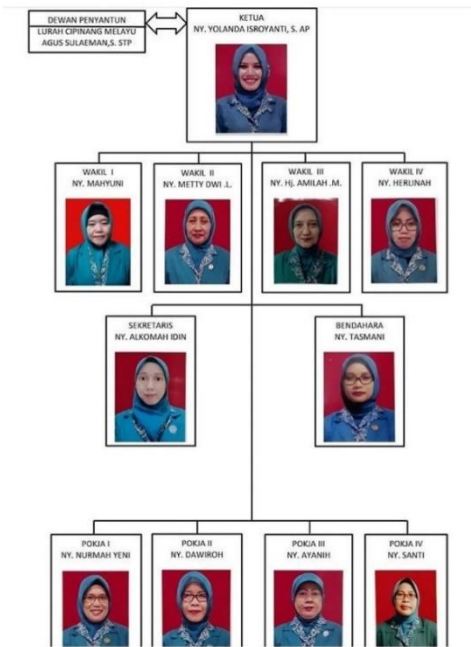
Gambar 2. Susunan Pengurus PKK Kelurahan Cipinang Melayu

Jika usaha ini dikembangkan secara konsisten dapat membuka lapangan kerja sehingga program ini secara berkesinambungan akan mengurangi pengangguran. Kegiatan ini sejalan dengan program pemerintah daerah DKI Jakarta,