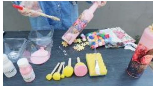
Gambar 13. Tutorial Pembuatan Decoupage