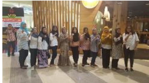
Gambar 3. Pelaksanaan FGD

Berikut adalah dokumentasi rangkaian kegiatan :