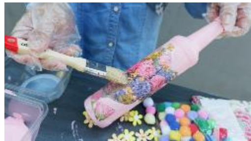
Gambar 14. Tutorial Pembuatan Decoupage