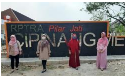
Gambar 10. Pelaksanaan Pendampingan