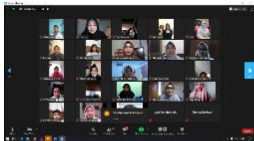
Gambar 5. Pelaksanaan webinar 2