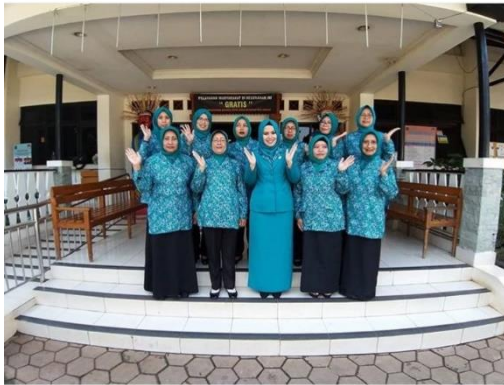
Gambar 1. Tim Penggerak PKK Kelurahan Cipinang Melayu