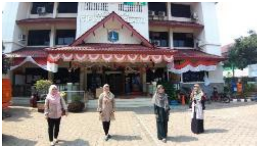
Gambar 8. Pelaksanaan Pendampingan