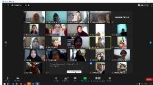
Gambar 4. Pelaksanaan webinar 1