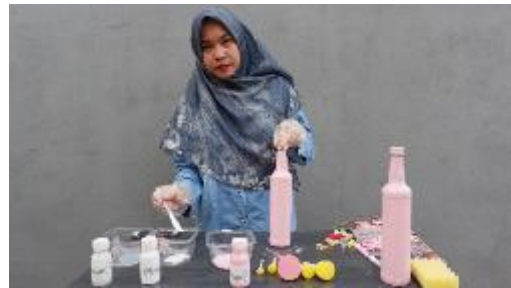
Gambar 12. Tutorial Pembuatan Decoupage