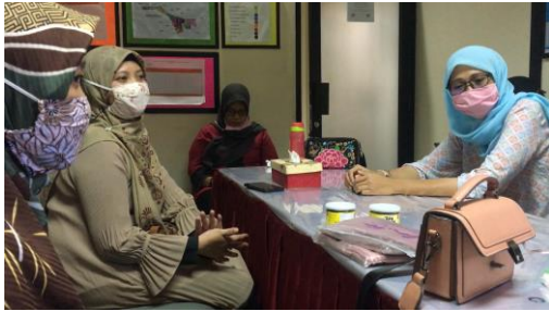
Gambar 7. Pelaksanaan Pendampingan