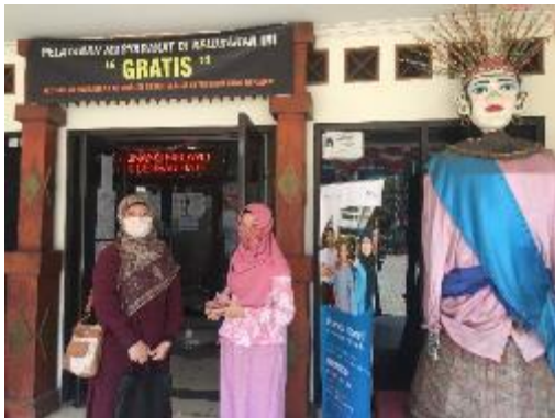
Gambar 9. Pelaksanaan Pendampingan