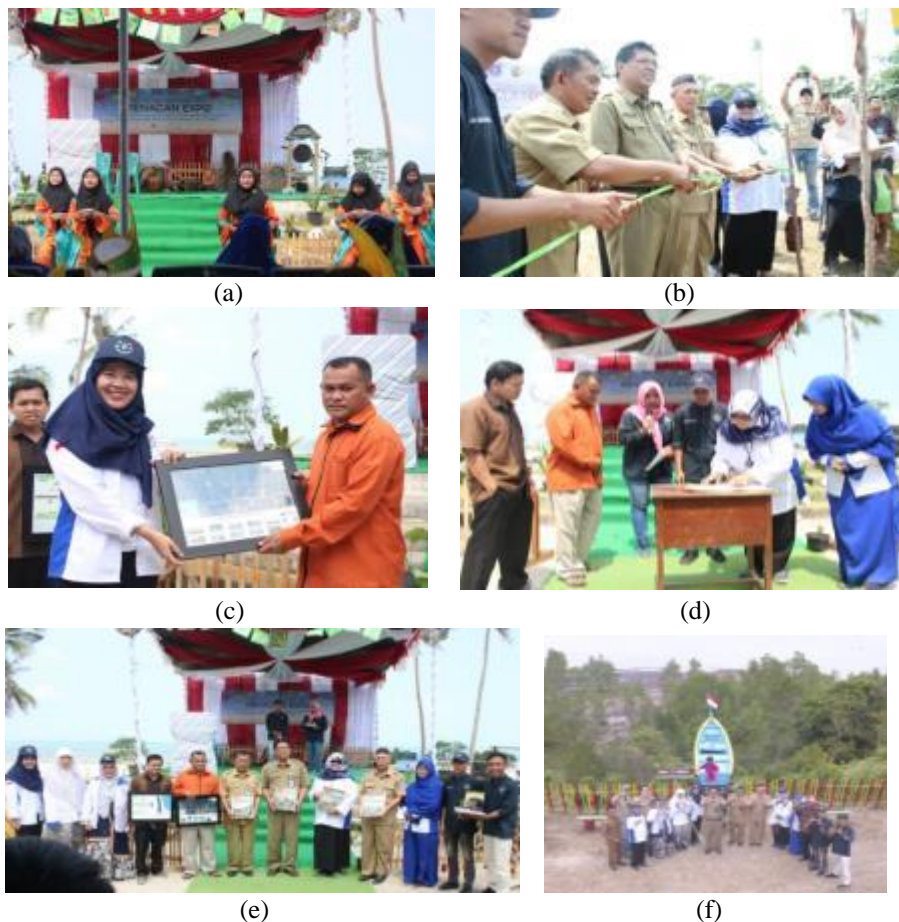
Gambar 4. Salah satu rangkaian acara pembukaan Penagan Expo dan Festival 2019, (b) pengguntingan pita sebagai tanda diresmikannya objek wisata Pantai Tanjung Raya oleh Kepala Dinas Kehutanan Propinsi Kepulauan Bangka Belitung, (c) Penyerahan peta wilayah ke Kepala Desa Penagan, (d) penandatanganan berita acara penyerahan desain objek wisata; foto bersama para undangan (e) setelah pemberian cinderamata dan (f) di salah satu spot foto Pantai Tanjung Raya

Dalam kegiatan peresmian ini dihadiri oleh Wakil Rektor II Bidang Administrasi Umum dan Keuangan UBB, Kepala Dinas Kehutanan Provinsi Bangka Belitung, Staf Ahli Bupati Bangka Bidang Perekonomian Sekretariat Daerah Kabupaten Bangka, Camat Mendo Barat, Kepala BAKK UBB, Kepala BPKKU UBB, Kepala Desa Penagan, Anggota BPD Penagan, Karang Taruna dan masyarakat Desa Penagan. (lihat Gambar 4).