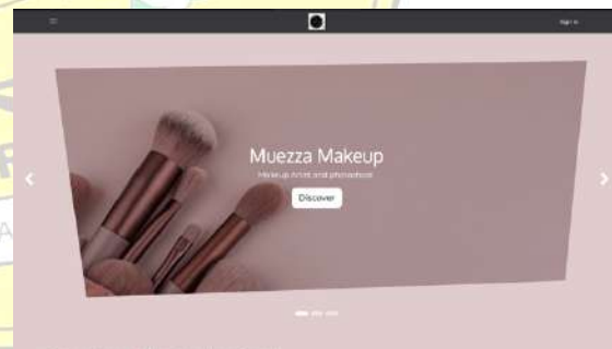
Gambar 1 Beranda Website