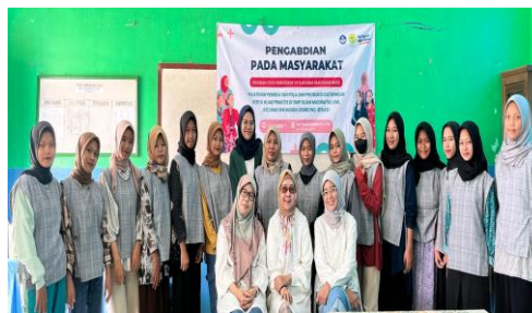
Gambar 2, Penutupan acara pelatihan

Berdasarkan table di atas dapat disimpulkan bahwa sebagian besar peserta belum memiliki pengetahuan dan keterampilan membuat busana outerwear , serta manfaat memiliki kompetensi membuat busana outerwear . Setelah dilaksanakan kegiatan ini, seluruh responden merasa termotivasi untuk merealisasikan pengetahuan dan keterampilan membuat busana outerwear dalam kebutuhan elemen busana seragam, serta bersedia mengikuti pelatihan selanjutnya pada materi tata busana lainnya. Menurut Firdita (2019) keterampilan membuat produk busana merupakan salah satu modal kecakapan hidup yang bermanfaat dan meningkatkan motivasi berwirausaha.