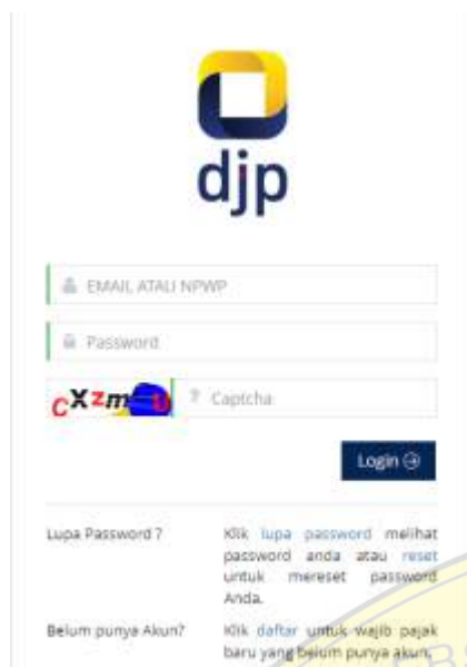
Gambar 1. Laman ereg.pajak.go.id