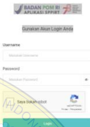
Gambar 4. Laman sppirt.pom.go.id

yaitu pembuatan PB-UMKU, karena diperlukan verifikasi persyaratan dari label pengawasan/pembinaan tempat pengelolaan pangan di kabupaten/kota. Maka dari itu tim penulis menunggu verifikasi dari label pengawasan tempat pengelolaan kabupaten/kota.