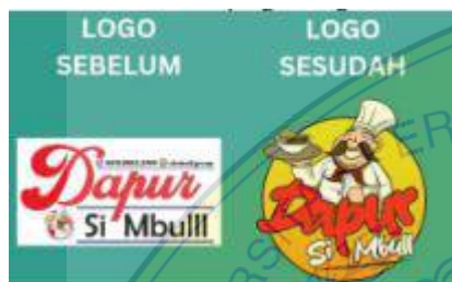
Gambar 7. Pendampingan Logo