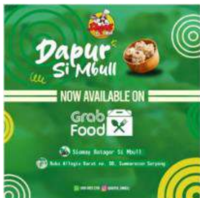
Gambar 6. Desain Poster