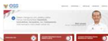
Gambar 2. Laman oss.go.id