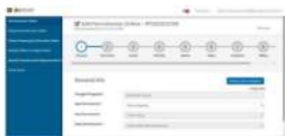
Gambar 3. Laman Dgip.go.id

Adapun hambatan yang muncul dalam proses pendaftaran HaKI dikarenakan adanya kendala pada waktu dan pembuatan janji temu. Hal ini dikarenakan UMKM Dapur Si Mbull sedang menerima banyak pesanan seperti catering, event dan bazaar pada periode waktu 10 - 17 November 2023. Sedangkan proses pengajuan surat-surat tersebut harus sesuai dengan KTP pemilik usaha, yaitu di Cikarang. Dengan adanya kendala tersebut dan pendampingan membutuhkan waktu yang panjang untuk ke lokasi UMKM. Oleh karena itu proses pembuatan HaKI terhenti sampai langkah ke-7 yang dimana pada langkah tersebut membutuhkan dokumen-dokumen yang sudah disebutkan sebelumnya