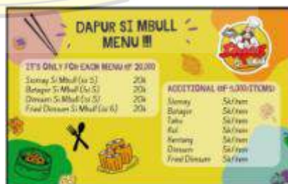
Gambar 5. Desain Menu

Selain melakukan pendampingan pada legalitas usaha dari UMKM Dapur Si Mbull, pendampingan juga dilakukan pada media promosi dengan melakukan branding pada UMKM Dapur Si Mbull. Branding yang dilakukan adalah melakukan remake pada logo, menu, dan poster UMKM Si Mbull, sehingga memiliki tampilan baru yang lebih modern dan mudah dikenali oleh pembeli.