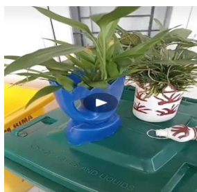
Gambar 3. Hasil Anorganik

Monitoring penerapan mekanisme Pendistribusian Sampah, dalam membantu perekonomian rumah tangga di Cluster Winola. Monitoring penerapan Aplikasi Nitipsampah.