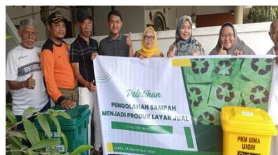
Gambar 6. Pelatihan Pengolahan Sampah