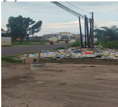
Gambar 1.1. Keadaan penumpukan sampah

pemilik tanah sudah berupaya untuk memasang himbauan dan peringatan untuk tidak membuang sampah di sana akan tetapi warga cluster winola tetap melakukannya dikarenakan tidak adanya tempat pembuangan sampah yang layak.