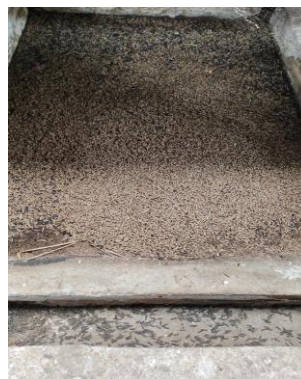
Gambar 4. Magot