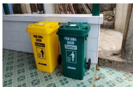
Gambar 5. Prototype Nitipsampah