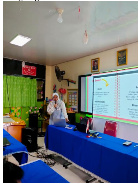
Gambar 2 Pelatihan Ms. Excell (tingkat Menengah) dalam Mengolah Data

Berikut beberapa foto selama kegiatan Pengabdian Masyarakat di SDN Tanjung Priok 02 berlangsung.