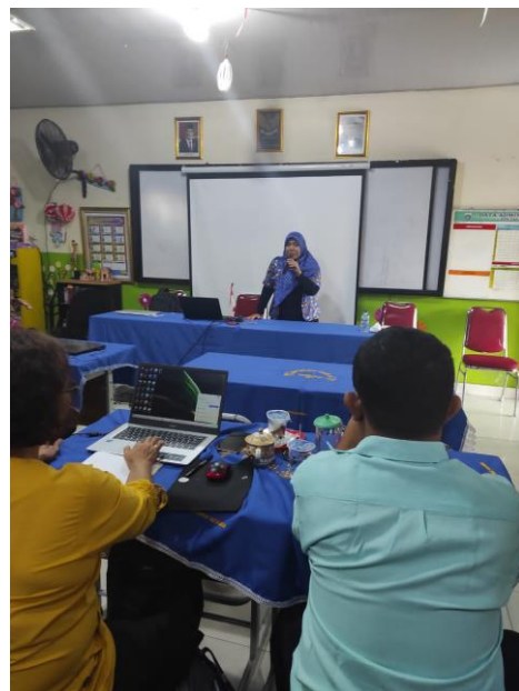
Gambar 3 Pembuatan Video Pembelajaran Dengan Ms Power Point