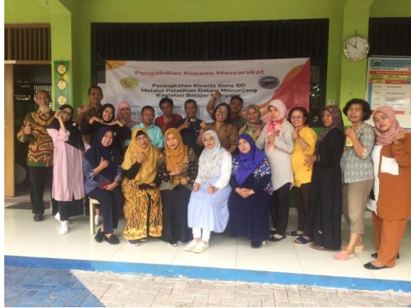
Gambar 4 Foto bersama Tim Pengabdian Masyarakat Fakultas Teknik Universitas Persada Indonesia YAI dan Guru & Pendidik SDN Tanjung Priok 02

Keberhasilan kegiatan ini terlihat dari banyaknya peserta yang hadir dan antusias peserta melalui keaktifan dan tanya jawab selama kegiatan berlangsung.