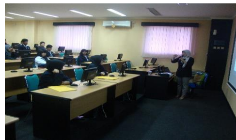
Gambar 1 : Pelaksanaan Pelatihan E-Commerce

menggunakan laboratorium komputer berbasis internet juga menggunakan laptop yang dapat berbasis off-line dan online dengan menggunakan modem portable . Contoh-contoh diberikan secara langsung melalui praktek yang dipandu oleh instruktur melakukan praktek di depan dan diikuti oleh peserta pelatihan. Jumlah peserta adalah tiga puluh orang.