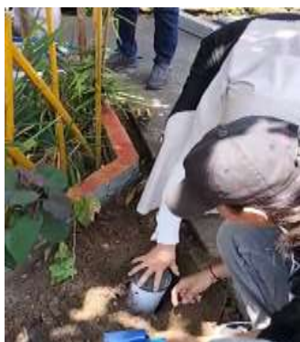
Gambar 8. Pemasangan Alat Biopori