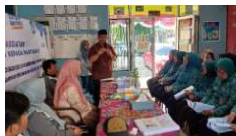
Gambar 3. Kata sambutan lurah Kel.Sialang

Pelaksanaan kegiatan dimulai dari bulan Juli 2023, yaitu dilakukan sosialisasi materi penerapan teknologi. Keterbatasan pengetahuan dan informasi masyarakat penanggulangan krisis air dan pemanfaatan kompos menjadi kendala dalam melakukan survei ini.