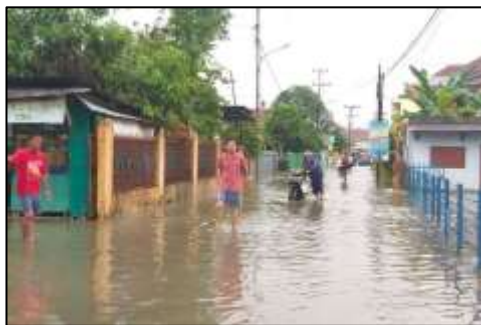
Gambar 1. Kondisi banjir di Kelurahan Sialang

Kelurahan sialang Kecamatan Sako Kota Palembang memiliki luas wilayah 291 Ha dengan jumlah Rukun Tetangga (RT) sebanyak 69 RT dan rumah tangga sebanyak 6.543 keluarga. Semakin padatnya jumlah penduduk dikelurahan tersebut maka akan semakin banyak pula sampah rumah tangga yang dihasilkan, baik sampah organik maupun anorganik. Sampah rumah tangga pada umumnya adalah daun, ranting, plastik, sisa makanan. Pengolahan sampah saat ini masih menjadi masalah yang kosen bagi masyarakat di Kecamatan Sako. Pengolahan sampah baik organik atau anorganik belumlah dapat diselesaikan secara menyeluruh, ditambah dengan permasalahan, kiriman sampah yang terbawa oleh arus sungai akibat hujan. Meski warga Kecamatan Sako telah mengolah sampah organik secara mandiri, tetapi pengolahan sampah yang dilakukan belum maksimal. .