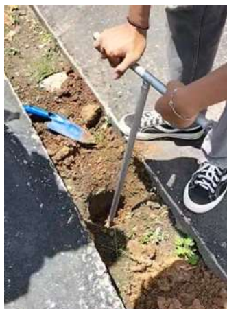
Gambar 7. Pembuatan Lubang Resapan Biopori