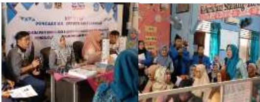
Gambar 5. Sesi Tanya Jawab dengan Mitra

Disamping itu pelaksanaan sosialisasi diawal ini juga untuk mengetahui kesesuaian program dengan kondisi tanah pada wilayah mitra. Selama kegiatan sosialisasi materi adanya sesi tanya jawab untuk mengetahui tingkat pemahaman dan meningkatkan rasa keingintahuan warga kelurahan Sialang tentang materi penerapan teknologi biopori.