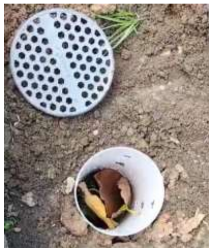
Gambar 9. Pembuatan Kompos dilubang Resapan Biopori