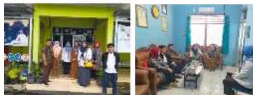
Gambar 2. Pra Kegiatan

Adapun pelaksanaan pra kegiatan dapat dilihat pada gambar dibawah ini :