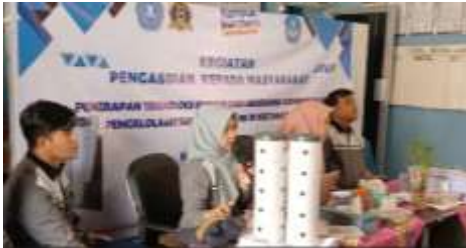
Gambar 4. Sosialisasi Materi Teknologi Biopori Oleh Tim Pengabdian

2020). Selain itu, adanya sosialisasi menjadikan adanya peningkatan kapasitas masyarakat untuk aktif secara mandiri dalam melakukan konservasi lingkungan.