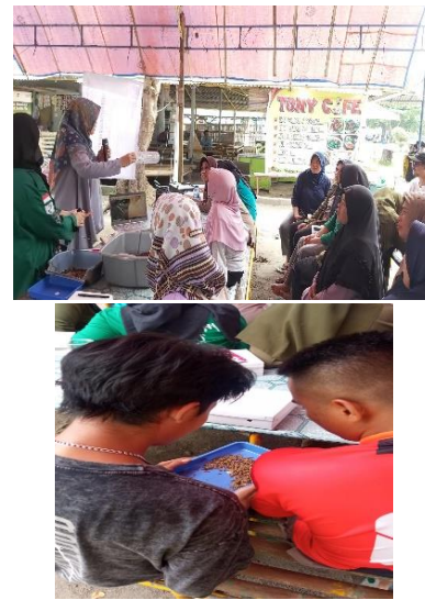
Gambar 1. Kegiatan pengabdian masyarakat di Pulau Pari

Persepsi peserta pelatihan terhadap pengelolaan sampah di Pulau Pari tergolong baik yaitu 78,5 sedangkan sikapnya sangat baik yaitu 80,3. Hal ini menunjukkan terdapat potensi yang besar dari kesiapan masyarakat untuk mengelola sampah menggunakan magot BSF.