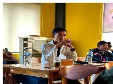
Gambar 5. Sesi diskusi oleh para pemandu wisata trekking Sentul.

Observasi yang dilakukan oleh Tim Pelaksana dengan dua hal, yaitu: 1) Observasi terhadap kebutuhan mitra dalam program