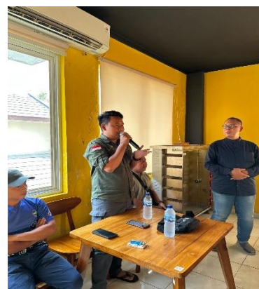
Gambar 7. Sesi diskusi oleh Pemandu Wisata Trekking Sentul, Bogor.