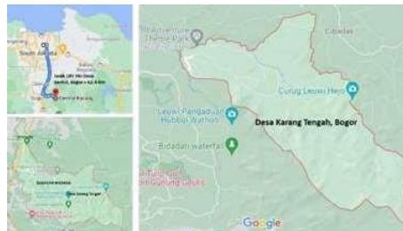
Gambar 1. Lokasi Desa Karang Tengah

kurang lebih 250 meter di atas permukaan laut.