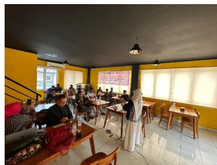
Gambar 4. Pemaparan materi yang dilakukan oleh ketua pelaksana

Aspek makro meliputi gambaran kondisi Kawasan wisata Sentul Bogor dan keberadaanya berdampingan dengan Sentul City sebagai Kawasan tertata, serta tingkat minat wisatawan terhadap wisata di Sentul Bogor. Secara mikro, observasi yang dilakukan terkait dengan wisata trekking merupakan bentuk aktivitas wisata yang sedang viral dan digandrungi oleh Masyarakat.