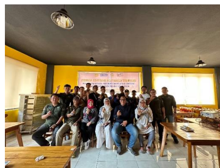
Gambar 6. Foto Bersama dengan Para Peserta FGD PKM Sentul, Bogor.