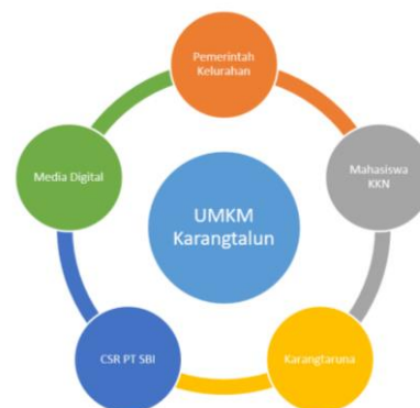
Gambar 5. Metode penta helix pada UMKM Karangtalun

Pengembangan UMKM berbasis digital akan berhasil apabila didukung dengan kolaborasi penta helix serta kegiatan penunjang yang inovatif. Sinergi yang terjalin antar berbagai pihak akan meningkatkan kualitas produk yang