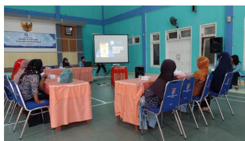
Gambar 1. Pentingnya Perizinan PIRT dan Konsep Merk Dagang dalam HAKI

dimulai pada tanggal 24 Juli 2022 hingga 2 Agustus 2022 dengan tujuan untuk mengetahui produk yang telah memiliki izin PIRT maupun memahami konsep HAKI terhadap merek dagang. Pada kegiatan tersebut dilakukan pendataan permasalahan yang terjadi pada izin produk. Setelah melakukan inventarisasi permasalahan tersebut selanjutnya dilakukan sosialisasi di Gedung Serba Guna Kelurahan Karangtalun. Dalam sosialisasi yang dihadiri pelaku UMKM tersebut dijelaskan mengenai apa itu PIRT, proses pembuatan serta mengapa sebuah produk harus memiliki perizinan. Selain itu, juga dijelaskan mengenai konsep HAKI (Hak Kekayaan Intelektual) dalam sektor merek dagang, proses pengurusannya, serta konsep hukum keperdataan yang mengatur orisinalitas dari merek tersebut. Kegiatan diakhiri dengan sesi tanya jawab dari peserta yang berfokus pada kendala dalam proses pengurusan PIRT tersebut.