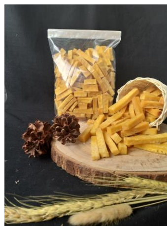
Gambar 3. Contoh Hasil Foto Produk Mandiri

yang menarik. Setelah itu foto produk dibagikan kepada para pelaku UMKM. Seluruh rangkaian kegiatan sosialisasi dilakukan di Gedung Serbaguna Kelurahan Karangtalun dan Posko KKN.