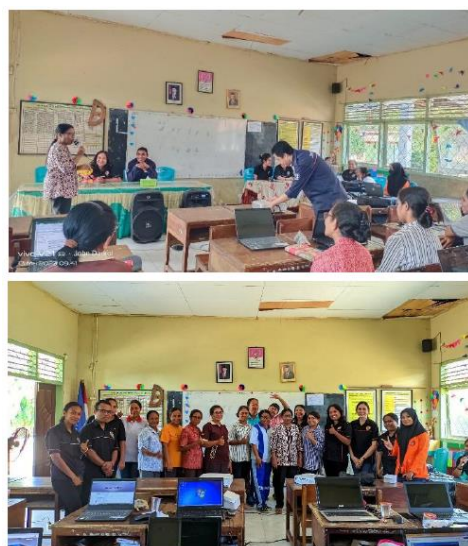
Gambar 1. Kegiatan Pengabdian Pemanfaatan Teknologi Informasi Pada SDI Kota Uneng

Seluruh staf pengajar di SDI Kota Uneng turut serta dalam kegiatan pengabdian masyarakat ini. Kegiatan ini dimulai dengan melakukan analisis kebutuhan di lapangan untuk mengetahui masalah yang dihadapi mitra. Salah satu kendala yang dihadapi mitra adalah kesulitan dalam menciptakan alat penyimpanan dan evaluasi untuk hasil pembelajaran, hal ini disebabkan oleh keterbatasan fasilitas di sekolah serta kurangnya pemahaman tentang pengembangan media pembelajaran berbasis teknologi informasi, baik dikalangan guru maupun siswa. Oleh karena itu, solusi yang kami tawarkan adalah menyelenggarakan pelatihan penggunaan Google Apps kepada guru – guru di sekolah mitra, dengan fokus pada penggunaan Google Apps sebagai alat penyimpanan dan media pembelajaran online, terutama untuk keperluan evaluasi pembelajaran.